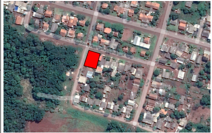
IMAGEM SATELITE SEM ESCALA ZONA: 22 J LONGITUDE EM UTM: 217524,85 m E LATITUDE EM UTM: 7159303,68 m S